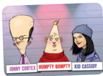
Carta del testigo